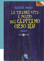
W. Moers, Le tredici vite e mezzo del capitano Orso Blu