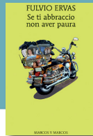
F. Ervas, Se ti abbraccio non aver paura