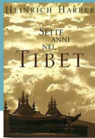
H. Harrer, Sette anni nel Tibet