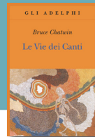
B. Chatwin, Le vie dei canti