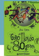
J. Verne, Il giro del mondo in 80 giorni